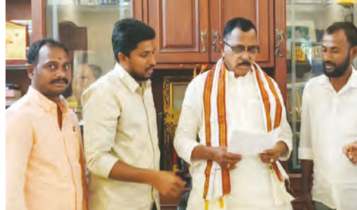
వెల్లిద్దూరు స్టేజి వద్ద శాశ్వత బస్ స్టాప్ ఏర్పాటుకు

అదర్శి అధికారులు, ఎంపీ ఎమ్మెల్యే సహకారంతో సాధించుకున్న బస్ స్టాప్