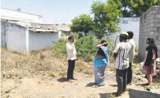
ఇళ్ల నిర్మాణాలను పరిశీలిస్తున్న అదనపు కలెక్టర్

ధన్వా రుణ సౌకర్యం కల్పించేందుకు అవసరమైన చర్యలు తీసుకోవాలని మండల ఏపీఎంలకు ఆదేశాలు జారీ చేశారు. జిల్లాలో మంజూరైన ప్రతి ఇంటినిర్మాణం పూర్తయ్యేలా సర్పంచులు, వార్డు సభ్యులు, గ్రామ కార్యదర్శులు, ప్రజాప్రతినిధులు మరియు మండల స్థాయి అధికారులు సమన్వయంతో పనిచేయాలని కోరారు. అలాగే మండల స్థాయి హాస్టింగ్ ఇంజనీర్లు నిర్మాణపనులను నిరంతరం పర్యవేక్షిస్తూ ఎటువంటి లోపాలు లేకుండా నాణ్యత ప్రమాణాలు పాటించేలా చర్యలు తీసుకోవాలని సూచించారు. జిల్లాలో ఇందిరమ్మ ఇళ్ల నిర్మాణాల పురోగతిని సేవించేందుకు సంబంధిత ప్రత్యేక దృష్టి సారించాలని ఆయన అధికారులకు తెలిపారు.