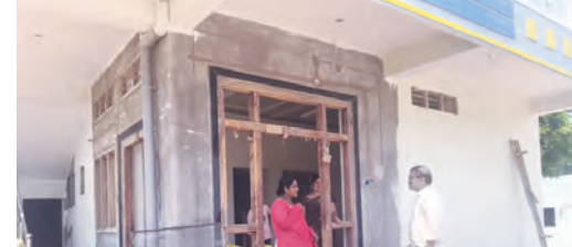
ఇందిరమ్మ ఇళ్ల నిర్మాణాలను పరిశీలిస్తున్న అదనపు కలెక్టర్

నిరుపేదలకు సదవకాశం మిడ్డీల్, లింబ్య తండాలో స్థానిక సంస్థల అదనపు కలెక్టర్ మధుసూదన్ నాయక్ పర్యటన ఇందిరమ్మ ఇళ్ల నిర్మాణాల పురోగతి పరిశీలన