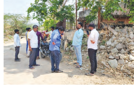
నీటి సమస్య గురించి